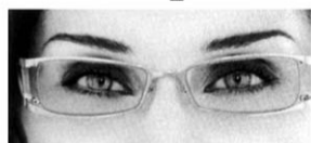
klar bei Nacht und in Innenräumen